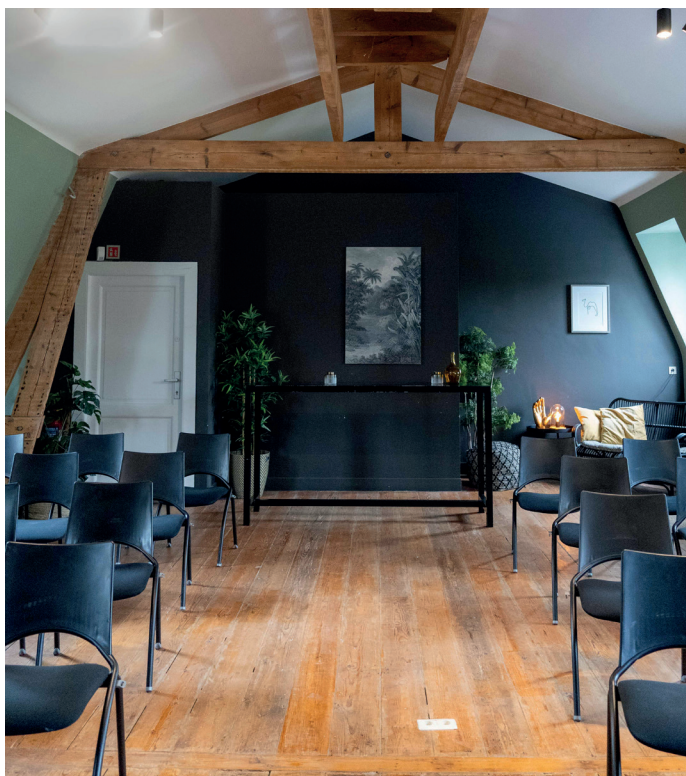
Theater: max 30 pers.