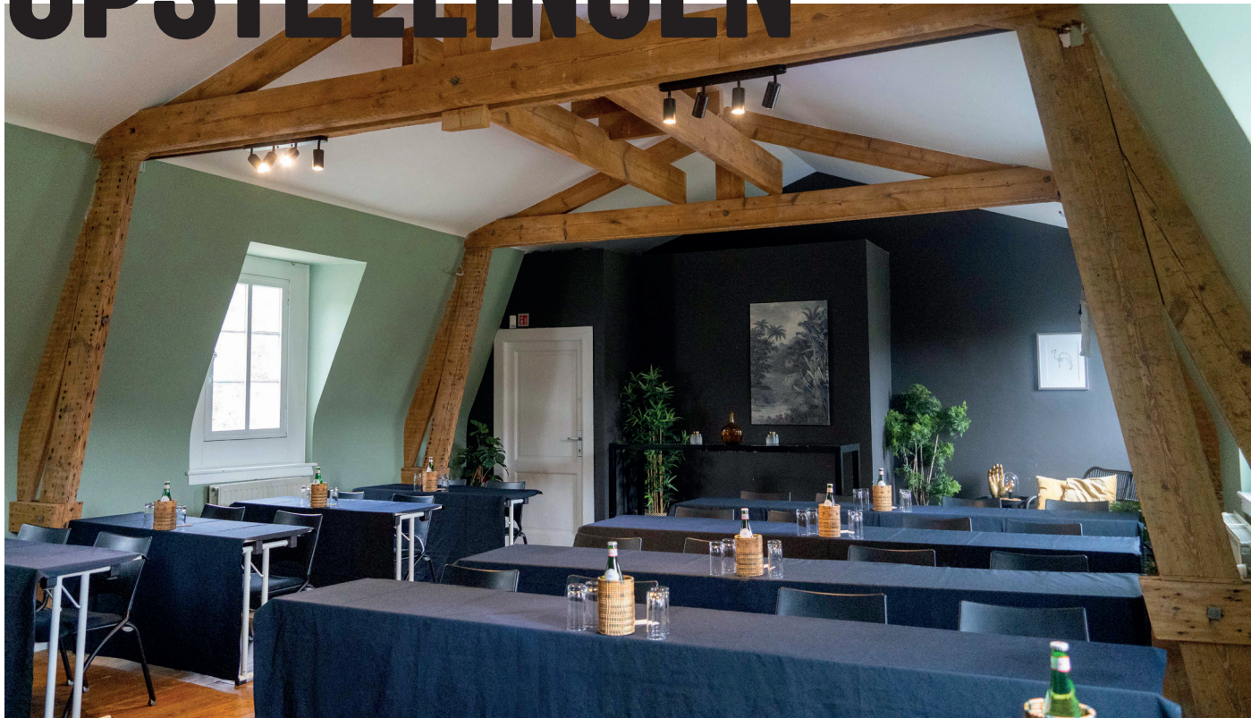
School: max 24 pers. + spreker