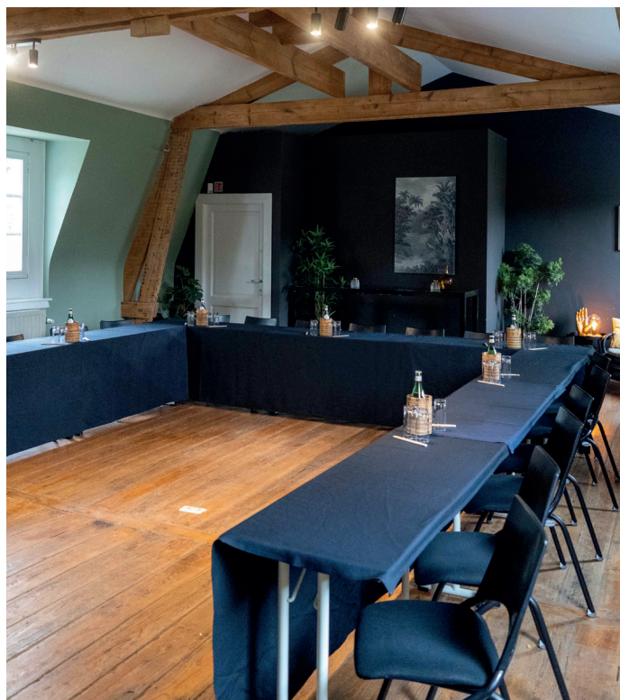
U-vorm: max 21 pers. + spreker